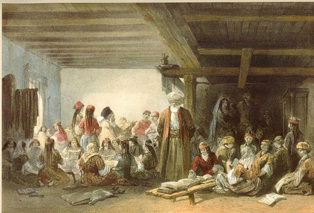
Tatar Children's School

У татар есть школьное образование на татарском языке. Ведётся по общероссийской программе и учебникам, переведённым на татарский язык. Исключения: учебники и уроки русского языка и литературы, английского языка и других европейских языков, ОВС, команды на уроках физкультуры могут быть на русском языке. Также есть татароязычное образование в некоторых факультетах казанских вузов, и в детских садах. Светская школа с десятилетним периодом обучения начала существовать у татар с введением обязательного среднего образования для всех граждан СССР. До этого роль образовательных учреждений выполняли медресе.